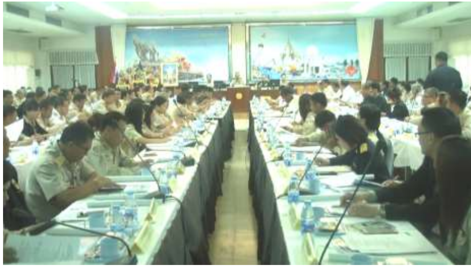
การประชุมหัวหน้าส่วนราชการประจำเดือน จังหวัดสุราษฎร์ธานี